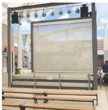
(ステージ参考写真)