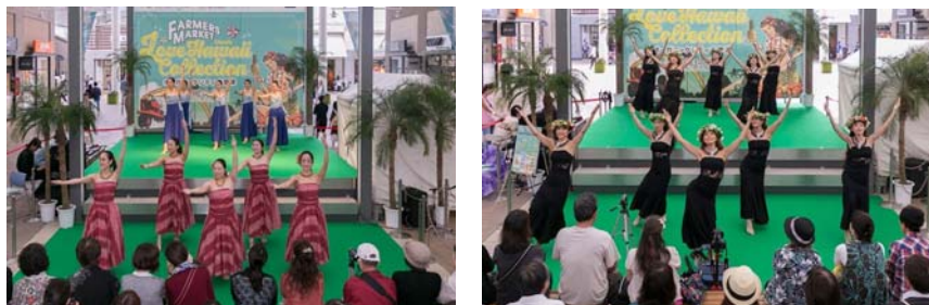
三井アウトレットパーク 木更津内ピアストリートステージ