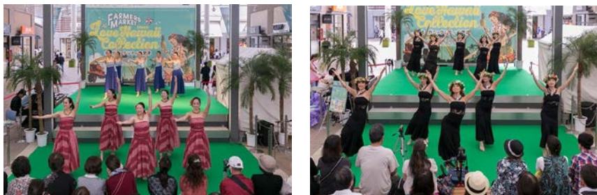
三井アウトレットパーク 木更津内ピアストリートステージ