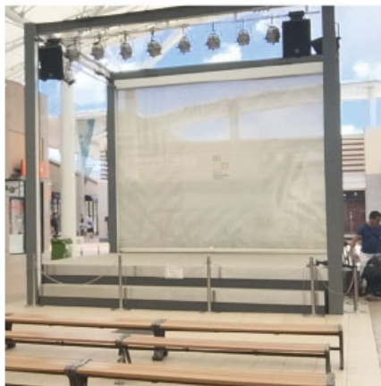
(ステージ参考写真)