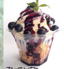
ブルーベリーパフェ