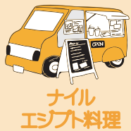
ナイル エジプト料理