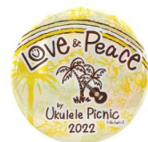
出演者様限定缶バッジ (参考写真：2022年開催時)

※開催当日、やむを得ない理由によりステージの進行を変更することがあります。予めご了承ください。